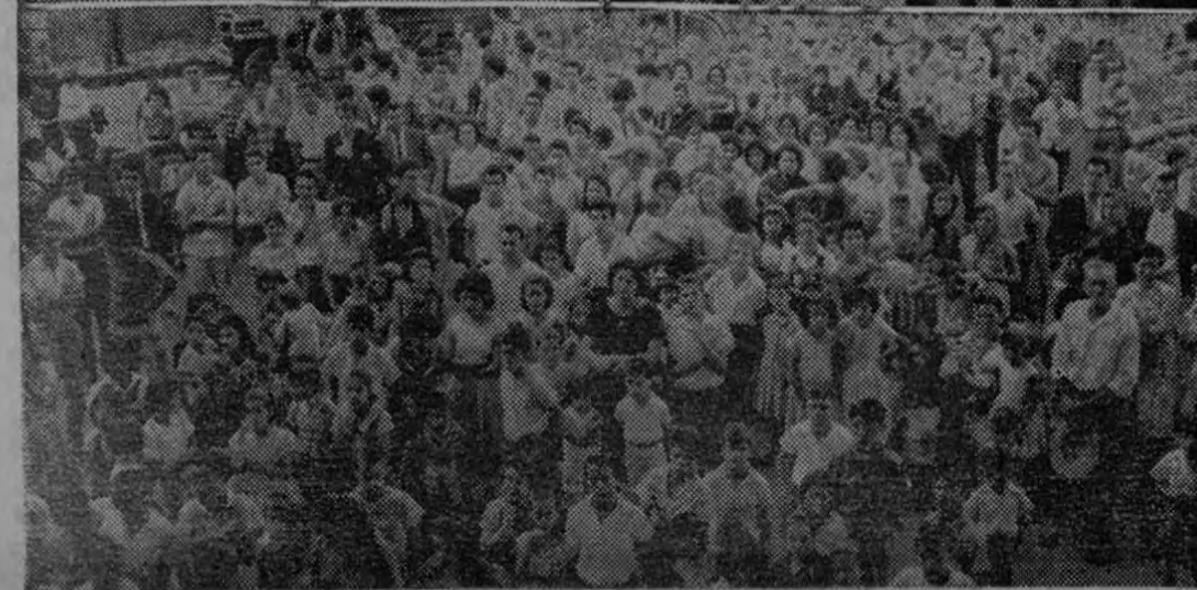
SANTUARIO DESDE HACE DOS DIAS. — A la izquierda, imagen de la Virgen de Lourdes que desde hace dos días dicen que se mueve. A la derecha las menores que dicen la vieron primero. Abajo panorámica del público que acudió en horas de la mañana.